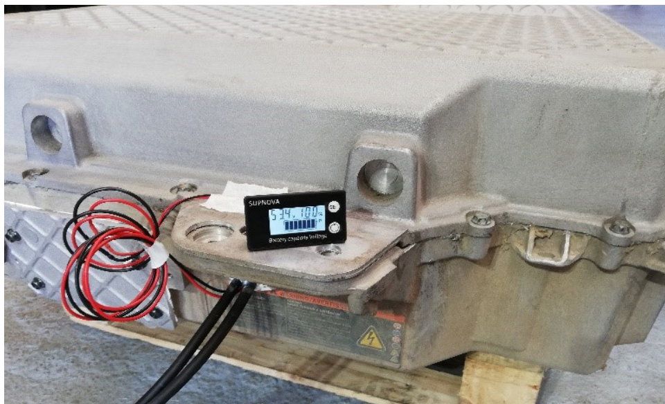
DÉTAIL DE L’AFFICHEUR/ JAUGE FOURNI AVEC LA BATTERIE

Garantie 2 ans extensible à 5 ans - Garantie de fourniture et de pièces détachés : 10 ans La construction modulaire de cette batterie garantit sa réparabilité.